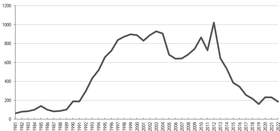
1. számú ábra: A regisztrált zsarolások idővonala, 1981–2022

A regisztrált zsarolások száma a nyolcvanas években sem szaporodott drasztikusan, 62 és 140 között alakult. A rendszerváltást követően azonban e téren is dinamikus növekedést lehetett tapasztalni. Domokos Andrea az erőszakos bűnözésről írt monográfiájában az ismertté vált elkövetők 2 vonatkozásában hangsúlyozza, hogy „külön említést érdemel a zsarolók arányának jelentős növekedése: 1988-ban 56, 1992-ben 203, míg 1996-ban már 589 fő szerepel” (DOMOKOS, 2000: 86).